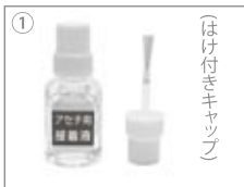
アセチ・セル用接着液 (6.0ml)