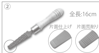
オリジナル樹脂ヤスリ(Z-2)